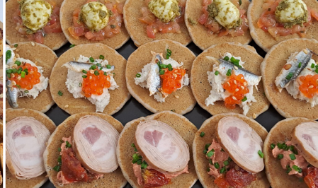
Kouigns de blé noir